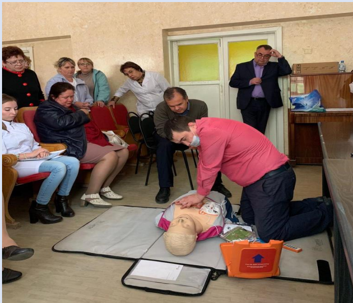
Семинар и мастер-класс по первичной сердечно-легочной реанимации для врачей

Также в рамках НМО и ТО циклов прошли обучение с сентября по ноябрь на симуляционных циклах в 2019 г.